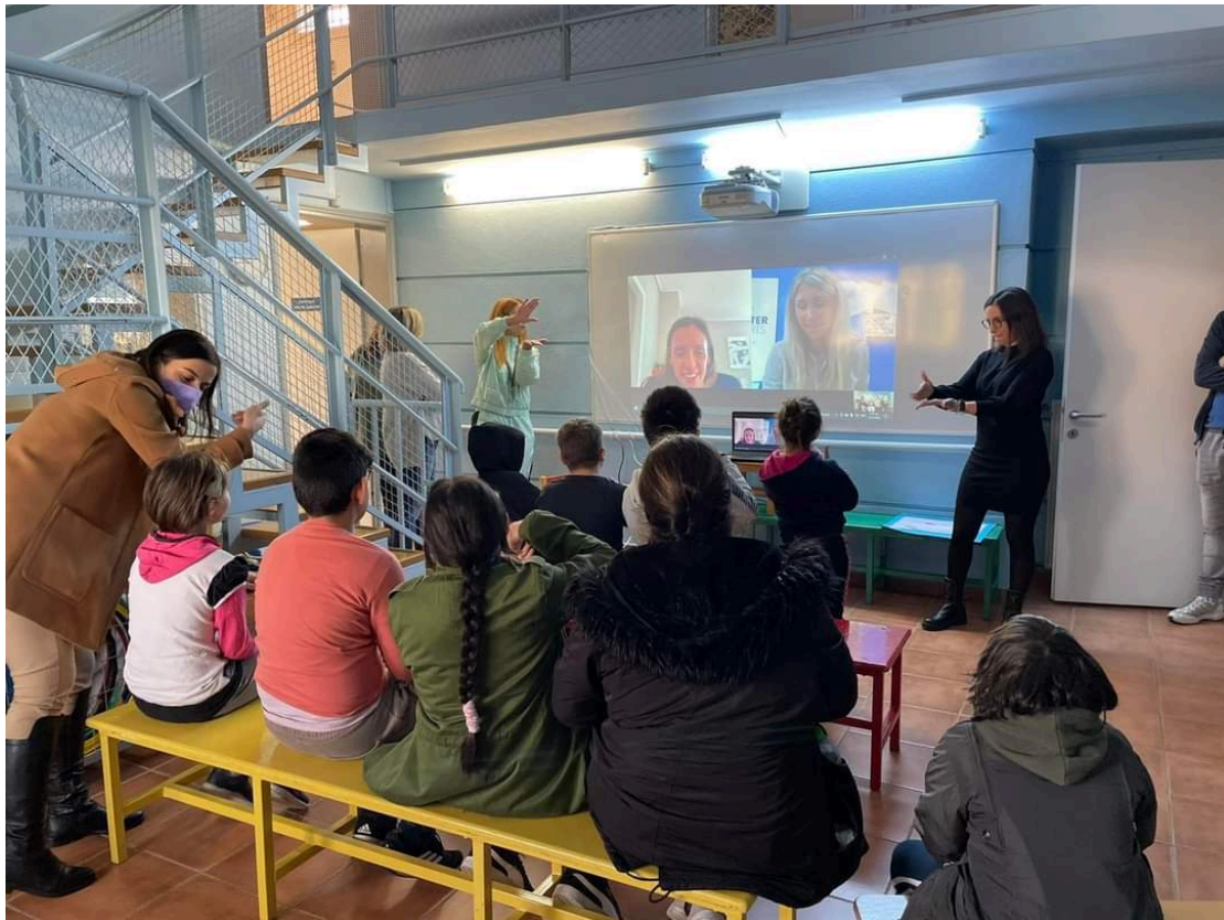
Διαδικτυακή συνάντηση με την διεθνή διακεκριμένη αθλήτρια Αγγελική Καραπατάκη.