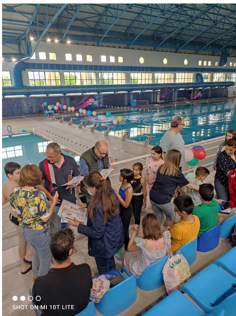
Καλοκαιρινή γιορτή – λήξη προγράμματος κολύμβησης και απονομή επαίνων στους μαθητές.