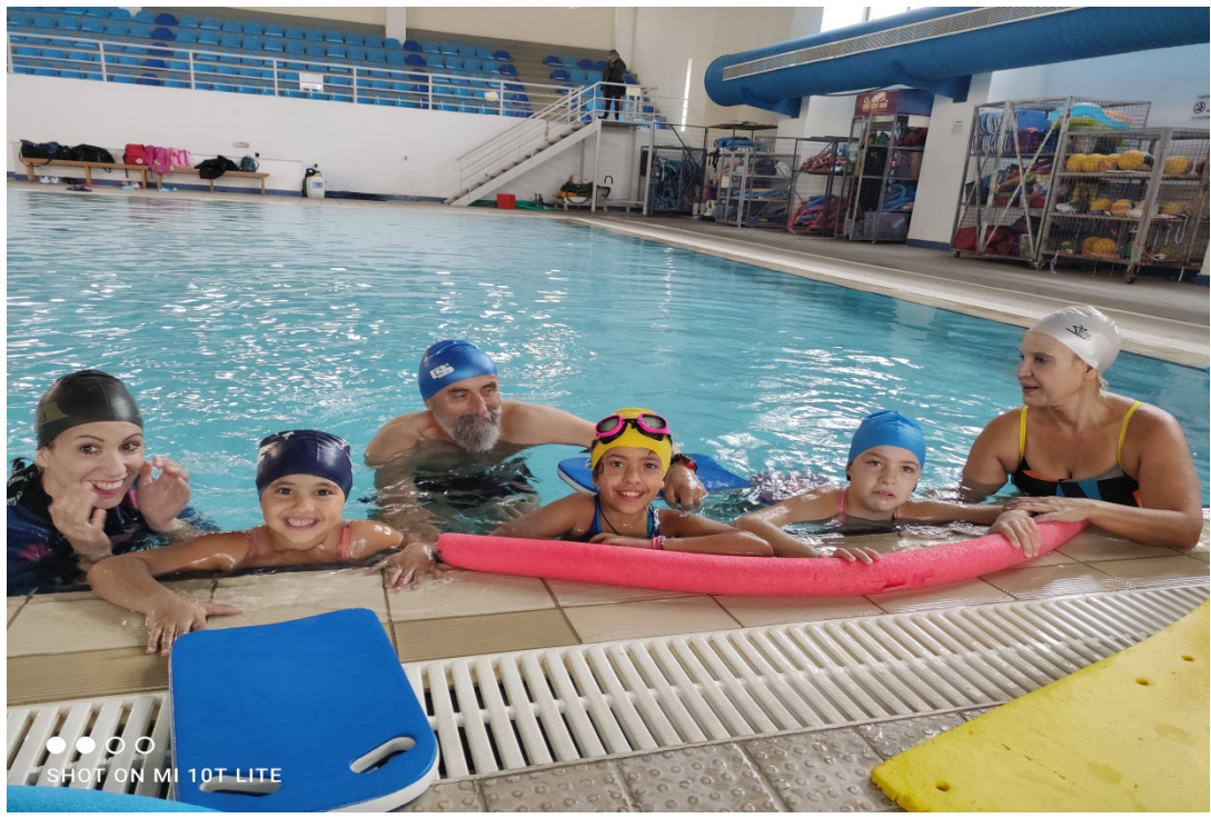
Εξοικείωση των μαθητών με το νερό στην πισίνα μέσω παιχνιδιών.