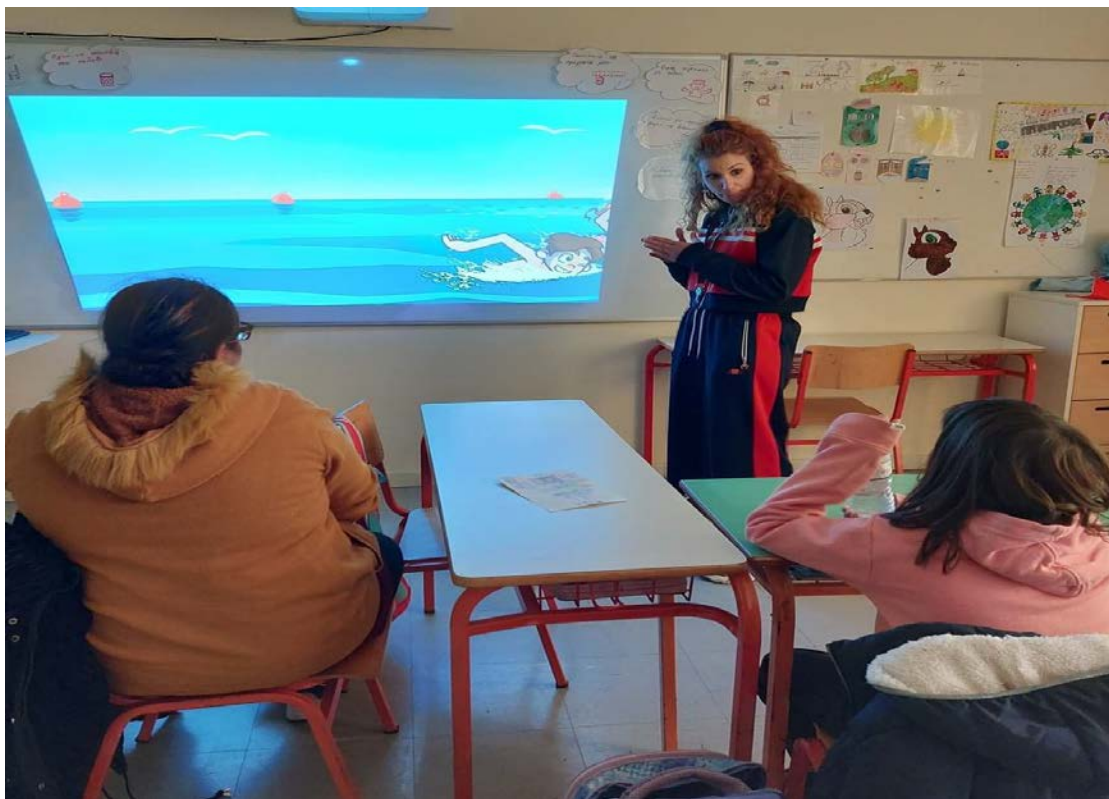
Επιμόρφωση στα βασικά στυλ κολύμβησης και στους κανόνες προσωπικής υγιεινής και ασφάλειας στην πισίνα.